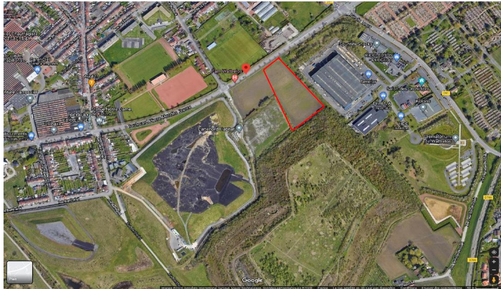
Emprise du terrain de la déchetterie

La MEL est propriétaire du terrain, actuellement cultivé.