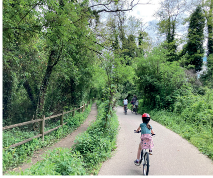
Des continuités vertes dédiées aux mobilités douces, avec une séparation des flux piétons-cyclistes