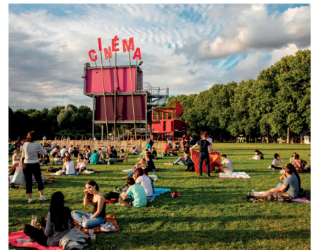
Des espaces pour accueillir de l'événementiel, de type kiosque à musique, amphithéâtre naturel, espace ouvert, pour des concerts, spectacles ou cinéma de plein-air...