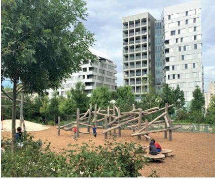
Des équipements ludiques et sportifs (aires de jeux, parcours santé, agrès sportifs, aire de pétanque...) avec des aménagements écologiques