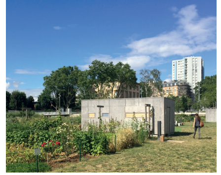
Des espaces pour des activités associatives ou de voisinage (jardins partagés...)