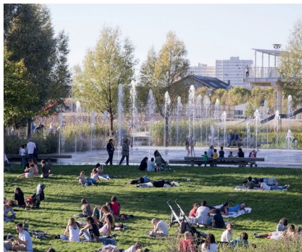
Des espaces appropriables pour des loisirs de plein-air, ludiques ou sportifs, proches d'un point d'eau pour se rafraîchir l'été