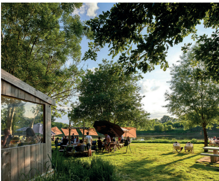
Des lieux de restauration conviviaux de type « ginguette », aires de pique-nique ou barbecue, ouverts toute l'année, en semaine et week-end, où se retrouver boire un verre ou manger en intérieur l'hiver ou en plein-air l'été...