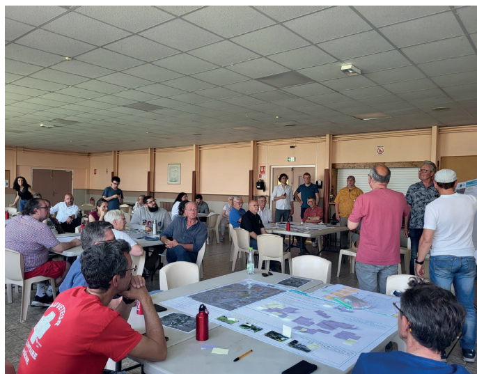
Photos prises par Ville Ouverte lors de la balade urbaine et de l'atelier sur table du samedi 10 juin 2023