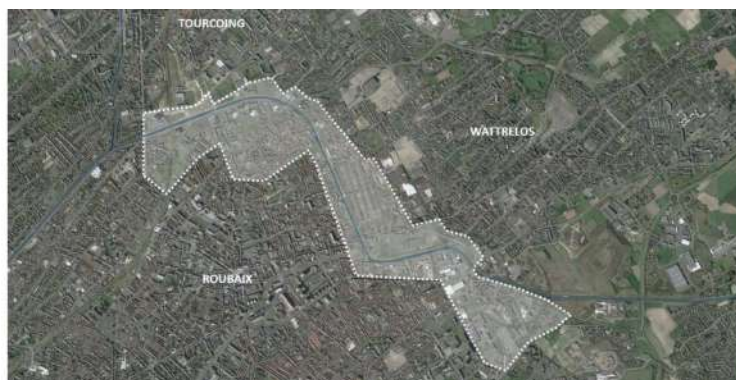
Périmètre d'intervention dessiné selon le paysage et les opportunités pour le futur PNU

La démarche de création d'un Parc Naturel Urbain s'inspire des Parcs Naturels Régionaux qui s'appuient sur les patrimoines naturels, architecturaux et paysagers de leurs territoires. Cette dynamique mise, avant tout, sur la confiance en la capacité des acteurs locaux, qu'ils soient institutionnels, associatifs, économiques, ou habitant, à construire ensemble un projet de développement local et durable pour leur territoire en s'appuyant sur ses atouts patrimoniaux souvent méconnus.