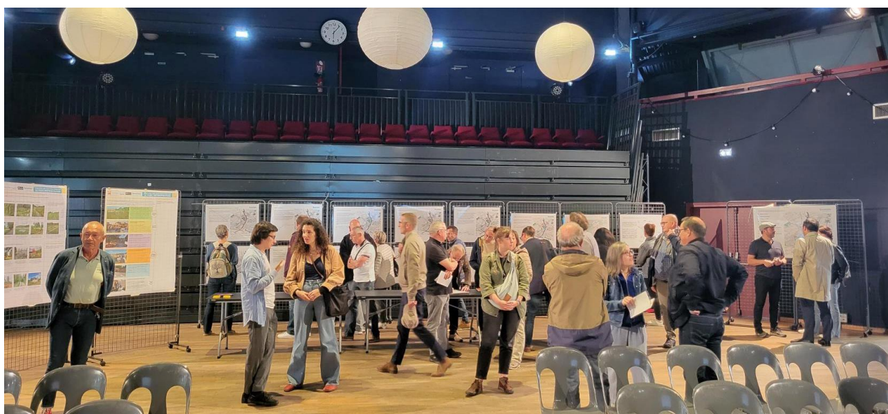
1/ Questions-réponses en fin de séance 2/ et 3/ Exposition des grandes orientations du plan-guide « Bords de Deûle »