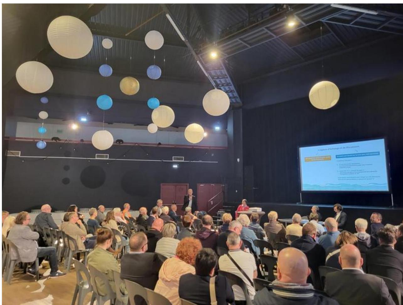
Séance plénière de la réunion publique de restitution de la concertation sur le site Solvay - 28/09/23

Déroulé : La réunion s'est tenue en salle Wauquiez (Saint-André-lez-Lille) de 18h à 20h30 et comprenait une séance plénière, un temps d'échanges avec la salle et un temps de circulation libre au sein d'une exposition sur le plan-guide Bords de Deûle.